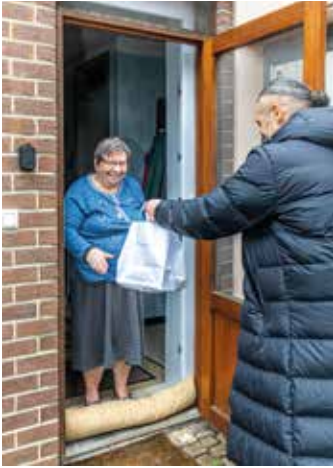
Cover: Frank Toussaint Samenlevingsopbouw RIMO Limburg